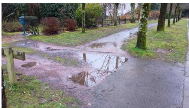
Flaques d'eau devant le 16 Av du BR